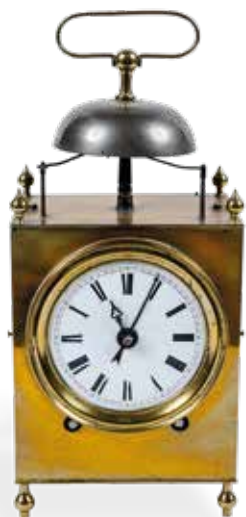
Pendule capucine en laiton. Époque début XIX ème siècle. 300 / 500€