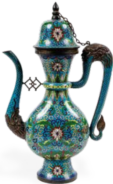
CHINE : Aiguière en émail cloisonné.

en bronze doré à décor en bas-relief d'une scène à l'Antique représentant Psyché et Cupidon attisant le feu d'une lampe à huile. Époque Directoire. Dim : 19 x 14 cm. 200 / 300€