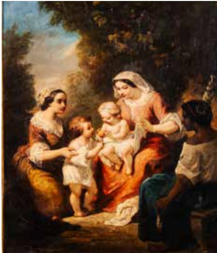
EUGÈNE JANDELLE (1825- ?): Enfants jouant avec leurs nourrices. Huile sur toile signée en bas à gauche. Dim : 54 x 46 cm. 700 / 800€