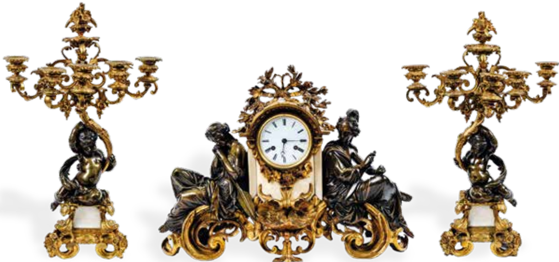
Garniture de cheminée Napoléon III en bronze à deux patines et marbre blanc, comprenant une pendule en forme de fontaine, signée THOMAS, flanquée de deux personnages mythologiques tenant un glaive et une lance. Et une paire de candélabres ornés de putti tenant une corne d'abondance à cinq bras de lumière. Dim de la pendule : 43 x 57 x 20 cm. Dim des candélabres : 55 cm de haut. 1 200 / 1 500€